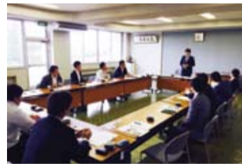
若手議員ネットワーク

・「Share金沢」は、高齢者、子供、障害児や学生が混然となって居住する画期的な「まち」。日本版CCRCとして注目される先進的な施設を視察してまいりました。