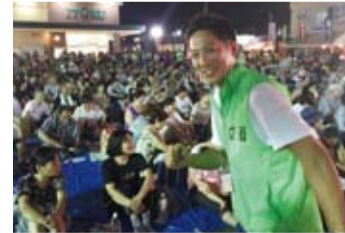
地元の夏祭りにて