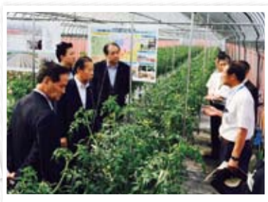
園芸メガ団地の視察