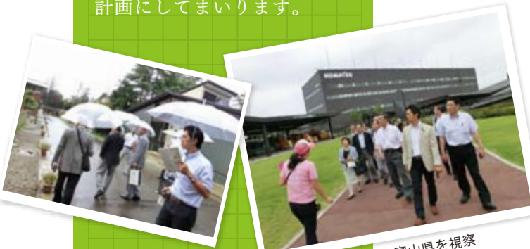
石川県と富山県を視察