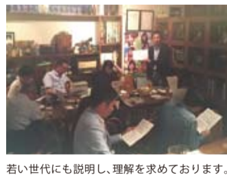
若い世代にも説明し、理解を求めています。

国民の生命と財産を守るという国家の最も根本的な責任をしっかりと果たすため、謙虚に、かつ強い信念をもって政治を進めてまいります。